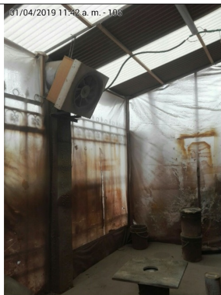
Fotografía No.4. Área de pintura.