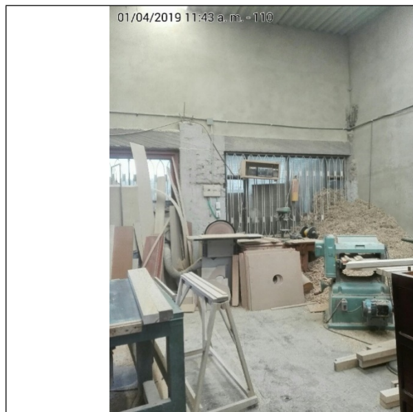
Fotografía No.3 Área de corte y pulido de madera.