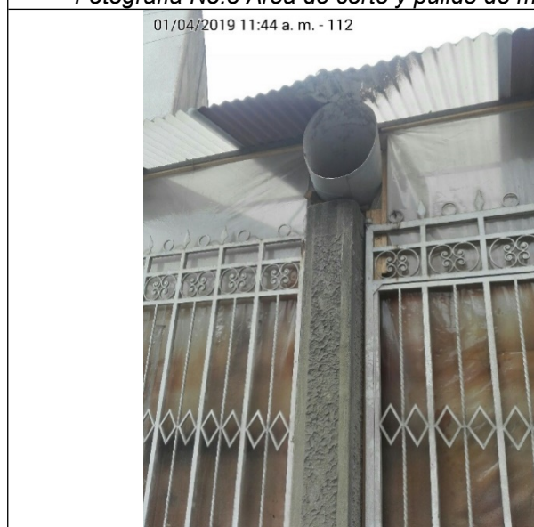
Fotografía No. 5. Punto de desfogue del ducto del área de pintura.